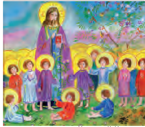
Художник М. Иванищева

Незадолго до Рождества Христова на небе появилась звезда, которую заметили ученые-звездочеты, волхвы. Видя, что она движется ни как обычные звезды, они пошли за ней. Звезда указывала им путь в город Вифлеем и остановилась над яслями, в которых лежал Господь Иисус Христос. Та звезда называется Вифлеемской.