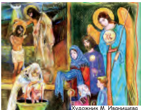
Художник М. Иванищева

Господь Иисус Христос тоже просил Иоанна крестить его. «Ты ли хочешь креститься? - удивился Иоанн. - Ведь ничего плохого в Тебе нет». Но Господь сказал, что это нужно. И когда Он выходил из воды, Иоанн увидел белого голубя над Его головой. А с неба раздался голос: «Ты сын мой возлюбленный!» Это был голос Бога Отца. А Иоанн говорил всем: «Приблизилось к вам Царствие Небесное». (По тексту М. Кучерской «Евангельская история для взрослых и детей»)