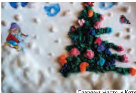
Гавревы Настя и Катя

- Нет, - сказала она серьезно, - я это в память... Давай оставлять конфеты с елки в память того дедушки и того мальчика.