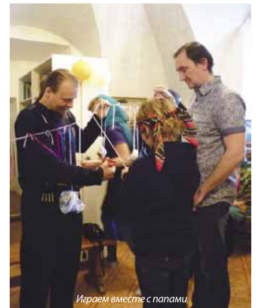
Играем вместе с папани

Её отец отличался большим благородством. Я обнял этого человека, поцеловал, поздравил с тем, что у него такая хорошая дочка. Сколько же я ему дал благословений! Такие люди приводят в умиление даже человека с самым чёрствым сердцем – что уж тут говорить о Боге!