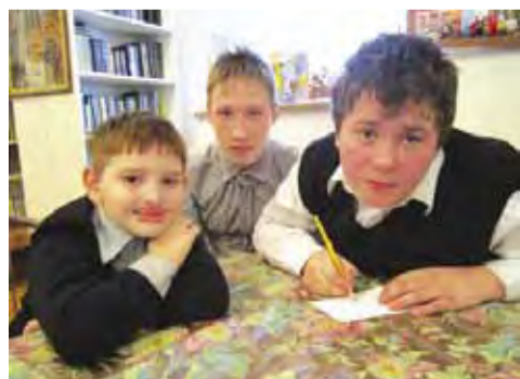
Готовимся к уроку