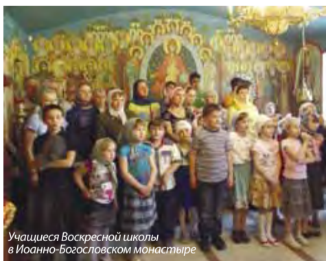
Учащиеся Воскресной школы в Иоанно-Богословском монастыре

Смерти не бойтесь, дети: кто может вам повредить, если Бог не попустит? А если судил Бог умереть – никто не убежит тебя. Божие хранение лучше человеческого...»