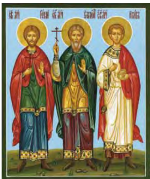
Святые мученики Гурий, Самон и Авив

Святые мученики Гурий и Самон были священниками в области Эдессы около 303 года, когда император Диоклетиан начал гонения на христиан. Они были обвинены в том, что помогали христианам, брошенным в темницы, и побуждали верующих не поддаваться угрозам и проявить стойкость даже при сожжении.