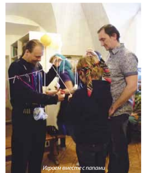
Играем вместе с мамой

Её отец отличался большим благородством. Я обнял этого человека, поцеловал, поздравил с тем, что у него такая хорошая дочка. Сколько же я ему дал благословений! Такие люди приводят в умиление даже человека с самым чёрствым сердцем – что уж тут говорить о Боге!