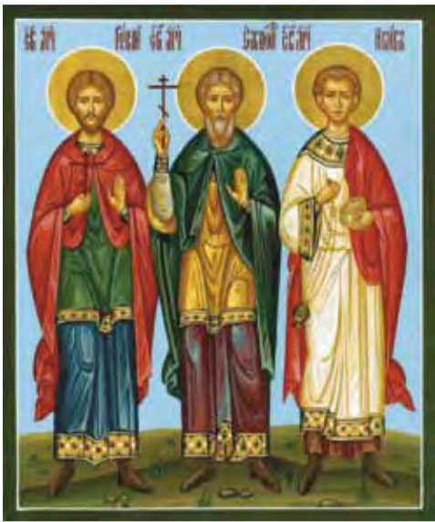
Святые мученики Гурий, Самон и Авив

Святые мученики Гурий и Самон были священниками в области Эдессы около 303 года, когда император Диоклетиан начал гонения на христиан. Они были обвинены в том, что помогали христианам, брошенным в темницы, и побуждали верующих не поддаваться угрозам и проявить стойкость даже при сожжении.