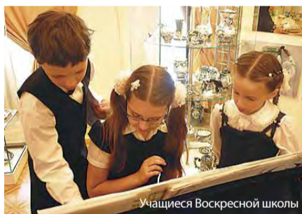
Учащиеся Воскресной школы