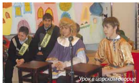
Урок в царском дворце