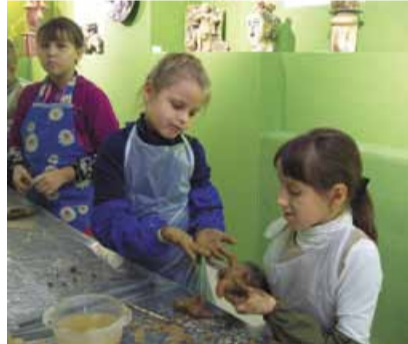
Бывает и так...