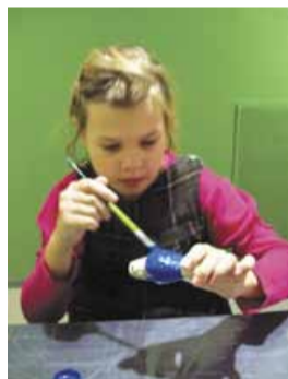
Моя первая роспись.