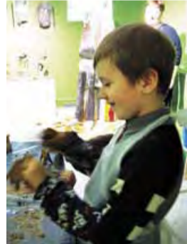
Чудо - глина!