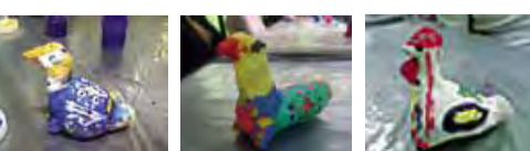
Работы учащихся Воскресной школы