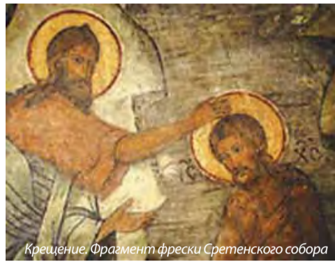
Крещение. Фрагмент фрески Сретенского собора

При пении "Глас Господень на водах" вышли из алтаря к народу священник и диакон. На водосвятной чаше зажгли три свечи. ... После молитвы священник трижды