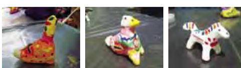
Наша первая игрушка-свистулька