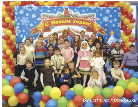
Вместе на празднике