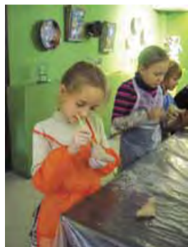
Главное - правильно поставить стек