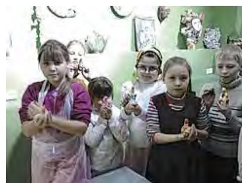
У нас настоящая радость!