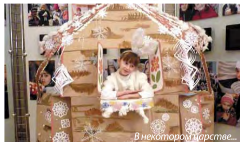
В некотором царстве...