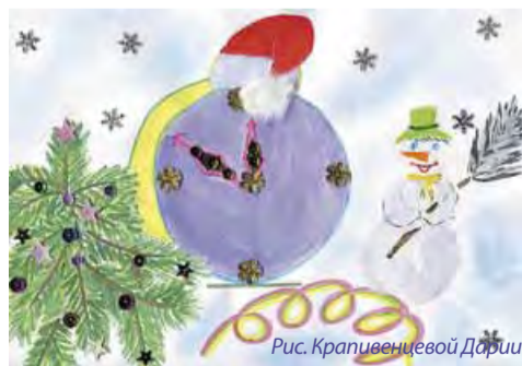
Рис. Крапивенцевой Дарии