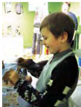
Чудо - глина!