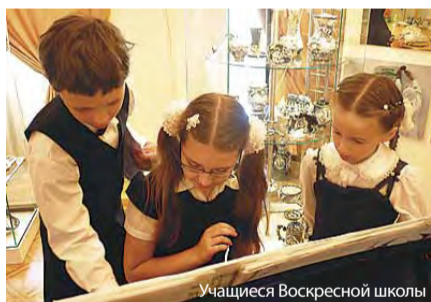
Учащиеся Воскресной школы