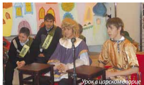
Урок в царском дворце