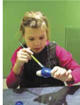
Моя первая роспись.