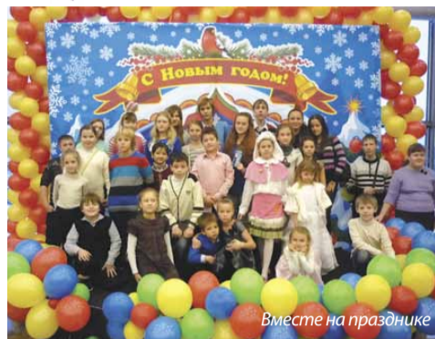
Вместе на празднике