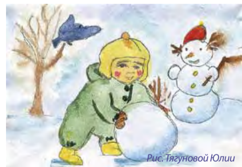
Рис. Тягуновой Юлии