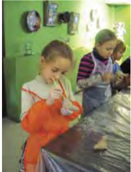
Главное - правильно поставить стек