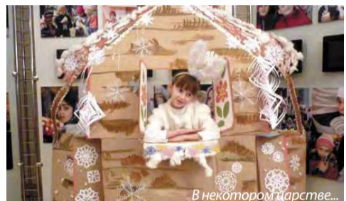
В некотором царстве...