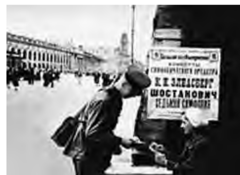
Афиша об исполнении седьмой симфонии

И был назначен день концерта – 9 августа 1942 года. Но враг по-прежнему стоял под стенами города и собирал силы для последнего штурма. Вражде-