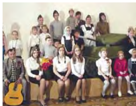
Концерт ко Дню Победы