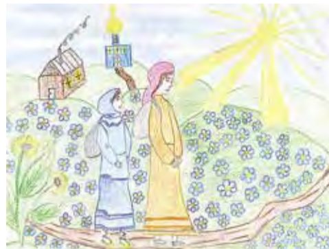
На Руси. Рыбина Ольга, 13 лет

Я слова вымолвить не могу, у меня слёзы из глаз от радости. Русь – светлое место! Русь – страна света. Милая свето-