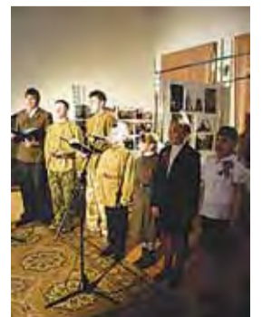
Концерт 9 мая