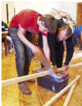
Подготовка к празднику