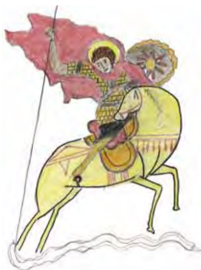
Святой Георгий Победоносец. Рисунок Ермилова Георгия