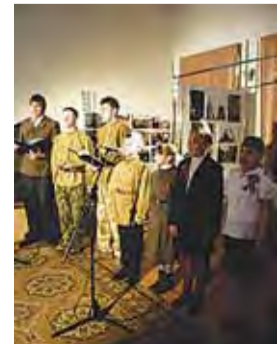
Концерт 9 мая