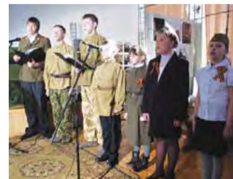
С Праздником, дорогие ветераны!