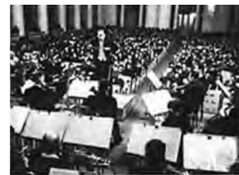
Исполнение «Ленинградской симфонии», 1942 г.

Почему же фашисты не стреляли? Нет, стреляли, вернее, пытались стрелять.