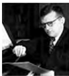
Д.Д.Шостакович за работой

9 августа 1941 года немцы обещали занять Ленинград. Ровно год спустя в несломленном городе состоялась премьера 7-ой симфонии Шостаковича, которую впоследствии назовут «Ленинградской». Зал был полон – очереди за билетами в Большой зал городской филармонии были длиннее, чем в булочные.