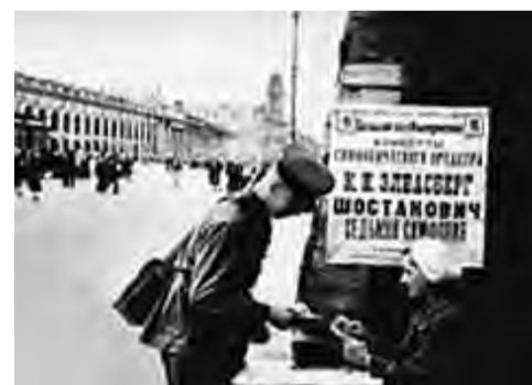
Афиша об исполнении седьмой симфонии

И был назначен день концерта – 9 августа 1942 года. Но враг по-прежнему стоял под стенами города и собирал силы для последнего штурма. Вражде-