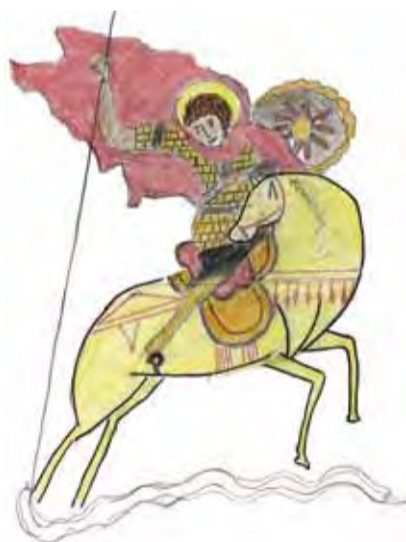
Святой Георгий Победоносец. Рисунок Ермилова Георгия