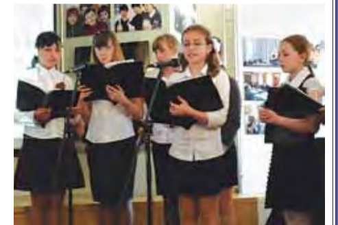
Поздравляем С Днём Победы!