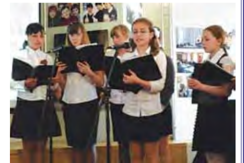
Поздравляем С Днём Победы!