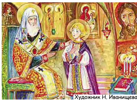
Художник Н. Иванищева

– Да, сынок. Ничего не жалеи, но если хотят отнять твою веру, стой крепко, до последнего, даже до смерти, потому что без веры ты мёртв.