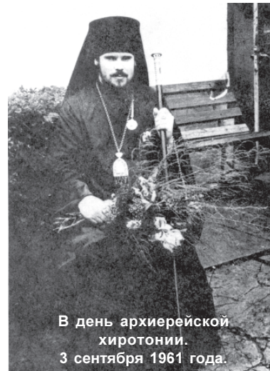
В день архиерейской хиротонии. 3 сентября 1961 года.

Распад исторически единого государства, экономические и социальные потрясения, политическая нестабильность — всё это легло тяжким бременем на плечи народа. Церковь, исполняя присущую ей миссию миротворчества, призывала к миру партии и политиков, принимала участие в разрешении политического кризиса в 1993 году, способствовала урегулированию международных конфликтов. Понесённые в минувшем столетии испытания дают о себе знать и сегодня: демографический кризис, крайнее имуще-