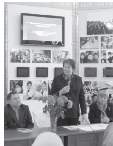
На страницах «Медицинского вестника» вы прочтете мнение участников конференции об этой проблеме.