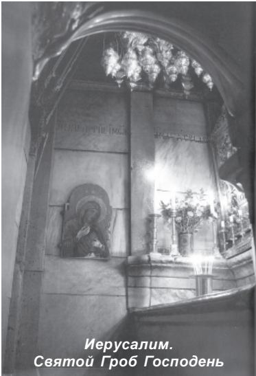
Иерусалим. Святой Гроб Господень