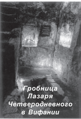
Гробница Лазаря Четверодневного в Вифании