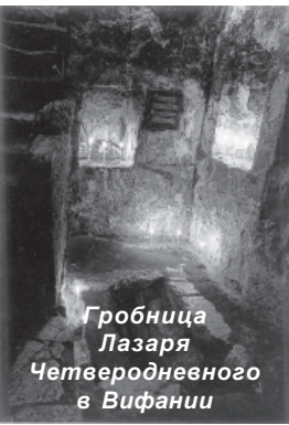
Гробница Лазаря Четверодневного в Вифании

Обессилевшего кашалота добили и пришвартовали к судну. Одно китобой кашалот убил, один - Джеймс Бартли - исчез. Два часа продолжа-