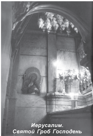
Иерусалим. Святой Гроб Господень