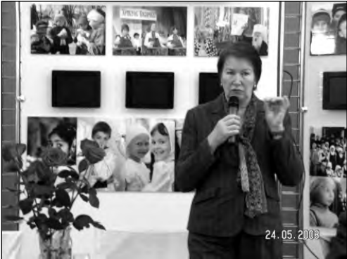
Профессор Н.А. Генне

Неврозоподобная симптоматика легкая, при умеренном курении или воздержании от него быстро проходящая, сводится к неприятным ощущениям «тяжелой головы», нарушению сна, повышению раздражительности, некоторому снижению работоспособности. Продол-