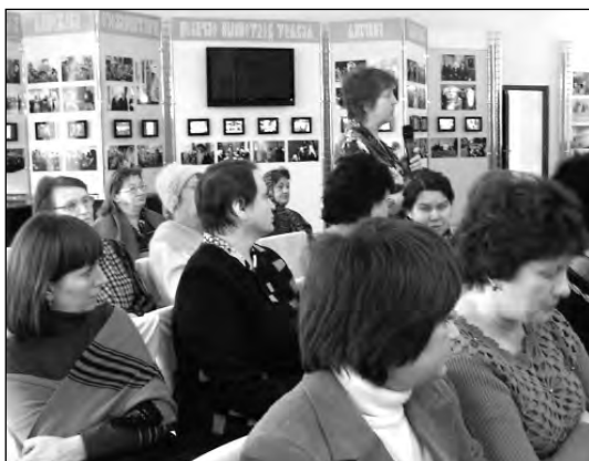
Вопрос из зала

Мазь: измельченный корень смешать пополам со сливочным маслом. Применяют при заболеваниях суставов.