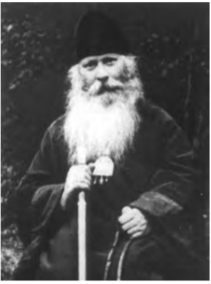
26 августа – день памяти Священномученика Серафима (Звездинского), епископа Дмитровского (1883-1937 г.г.).

В 1932 году епископ Серафим был отправлен в ссылку в Ишим, откуда писал духовным чадам: «Мир вам и благословение, дорогие мои. Цветите для Царствия Божия, завяньте совсем для ада. Будьте Божиим, а не вражьи. Друг друга любите, друг друга прощайте, не укоряйте, не судите, гнилых слов не говорите. В мире со страхом Божиим живите, смертный страшный час вспоминайте, и суд Христов нелицеприятный никогда не забывайте, храм Божий усердно посещайте, в грехах кайтесь. Святых Христовых Таин причащайтесь. Милость Божия и покров Царицы Небесной да будет со всеми вами отныне и до века».