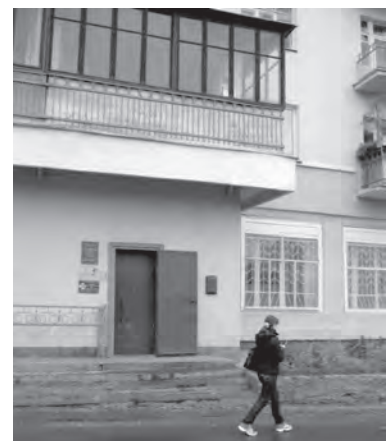
Здесь располагается Центр «Жизнь».