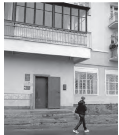
Здесь располагается Центр «Жизнь».