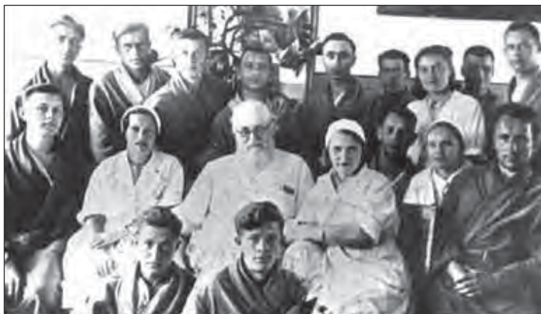
1944 г. епископ Лука – профессор В.Ф. Войно-Ясенецкий, главный хирург госпиталя