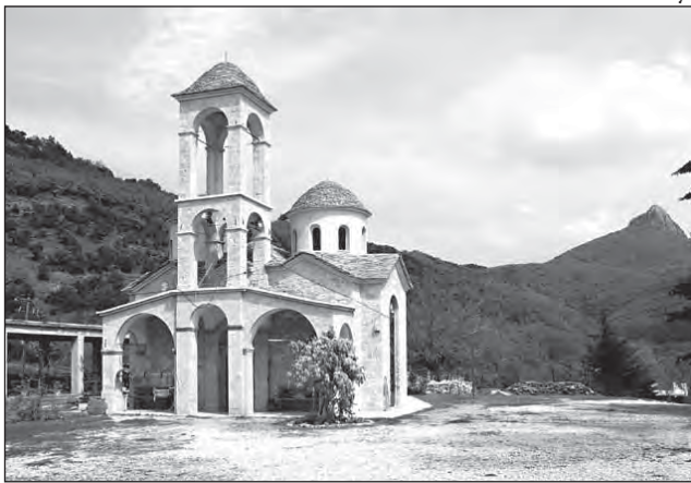
В монастыре Креста в Фивах

езжает ко мне на исповедь. 12 декабря утром он пришел ко мне с пакетом в руках и сказал, что Святитель Лука явился Владыке Лазарю во сне и сказал: «Ты должен написать три моих иконы: одну - для Вселенского Патриарха, другую - для Митрополита города Фивы Иеронима, а третью отдай отцу Георгию в Русский храм в Афинах». - Владыка Лазарь - передал эту икону Вам, - закончил рассказ отец