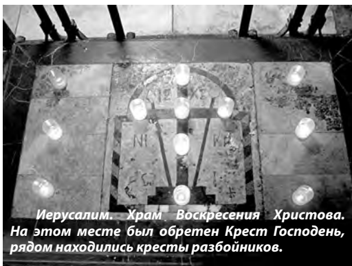
Иерусалим. Храм Воскресения Христова. На этом месте был обретен Крест Господень, рядом находились кресты разбойников.

И сказал Иисусу: помяни меня, Господи, когда приидеши в Царствие Твое! И сказал ему Иисус: истинно говорю тебе, ныне же будешь со мною в раю!» (Лк.23:39-43)