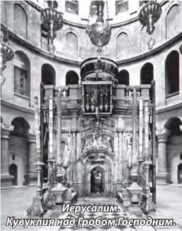
Иерусалим. Кувуклия над Гробом Господним.

Задумывались ли вы когда-нибудь над тем, как огромно, как бесконечно величие апостолов?