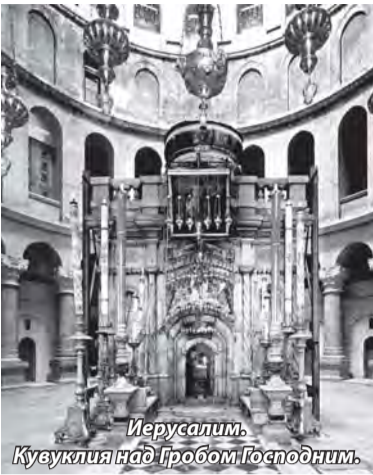
Иерусалим. Кувуклия над Гробом Господним.

Задумывались ли вы когда-нибудь над тем, как огромно, как бесконечно величие апостолов?