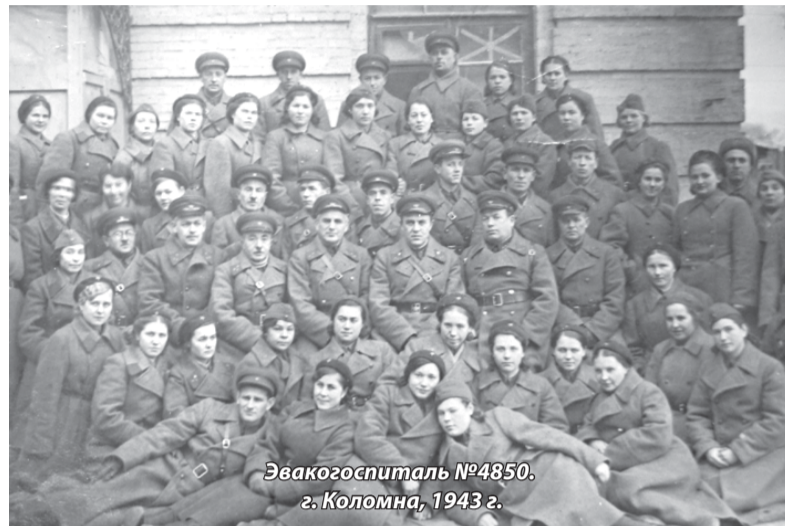
Эвакогоспиталь №4850. г. Коломна, 1943 г.