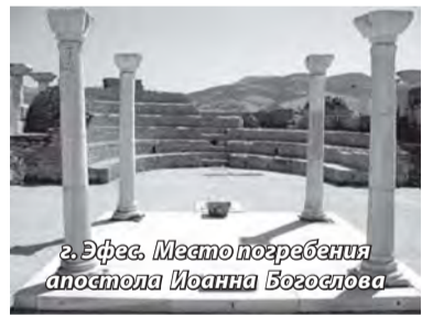
г. Эфес. Место погребения апостола Иоанна Богослова

Из «Слова в день преставления св. апостола Иоанна Богослова» святителя Луки (Войно-Ясенецкого)