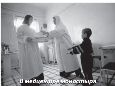
В медцентре монастыря