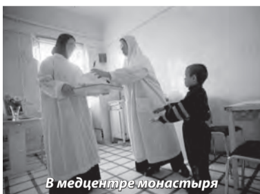
В медцентре монастыря