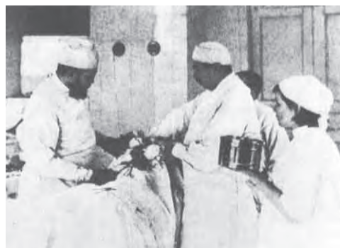
Архиепископ Лука (профессор Войно-Ясенецкий) в операционной

Его труд «Дух, душа и тело» - научное и богословское объяснение сущности человека.