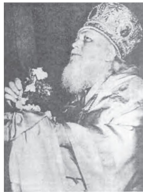
Святитель Лука (Архиепископ Лука Крымский и Семферопольский)

Наука без религии - «небо без солнца». А наука, облеченная светом религии, - это вдохновенная мысль, пронизывающая ярким светом тьму этого мира. Я - свет миру. Кто последует за Мною, тот не