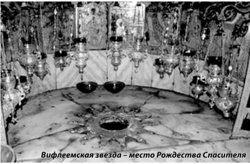
Вифлеемская звезда – место Рождества Спасителя

Древние пророки первыми вскапывали почву жестких человеческих сердец, подготавливали ее к последующему принятию семян апостольской проповеди. (Иоан. 4:37-38)