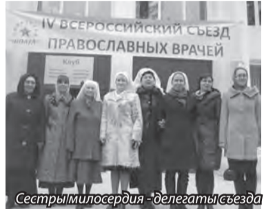
Сестры милосердия - делегаты съезда

зервные», или «утраченные возможности» человеческого мозга и естества обусловила преломление