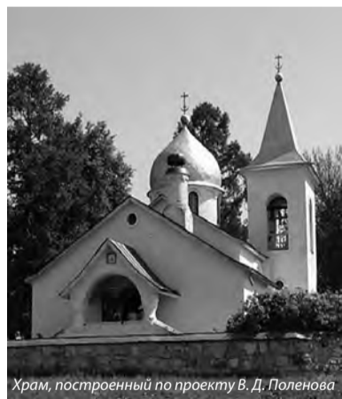
Храм, построенный по проекту В. Д. Поленова

Четырнадцатилетним подростком Василий Поленов увидел на выставке в Академии художеств картину Александра Иванова «Явление Христа народу». Огромное полотно поразило его. Именно тогда он мечтал не только стать художником, но и продолжить дело великого мастера и, как скажет он об этом позже, «создать Христа не только грядущего, но уже пришедшего в мир и совершающего Свой путь среди народа». Придет чуть более четвер-