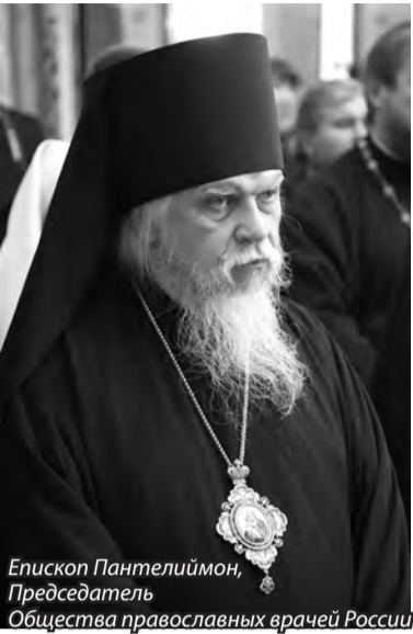
Епископ Пантелеймон, Председатель Общества православных врачей России