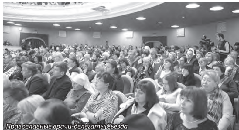
Православные врачи-делегаты Съезда