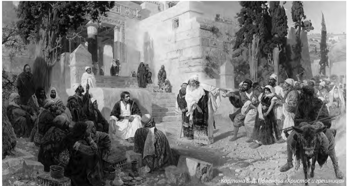
Картина В. Д. Поленова «Христос и грешница»

Василий Дмитриевич в конце жизни, в тот период, когда Церковь в России была гонимой, ходил по праздникам в храм. У себя в Поленово построил храм и написал литургию для хора. Он увлекался работой по созданию в Москве народного