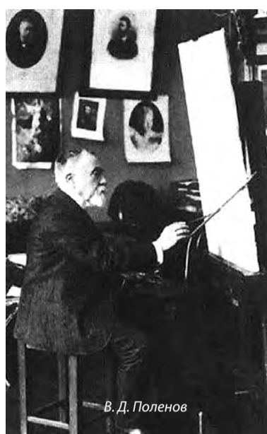
В. Д. Polenov

Творчество Василия Дмитриевича Поленова (1844—1927гг.) — одно из самых значительных явлений в русской живописи второй половины XIX века. В 1908 году Василий Дмитриевич Поленов заканчивает ряд полотен, объединенных Евангельскими сюжетами. В 1909 году 58 картин были показаны на выставке в Петербурге, 64 — в Москве и других русских городах. Первой картиной этого цикла стала картина «Христос и грешница». Это была обещанная дорожному человеку, сестре Вере, картина, которая стала открытием для многих современников художника.