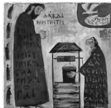
«Христос и самарянка» Картина Е. Черкасовой

А от такого зла существует ли какое-нибудь лекарство? Это сила и власть Божия. Бог даровал эту власть в лице апостолов священникам Своей Церкви; дал им неограниченное право разрешать, прощать всякого рода грех.