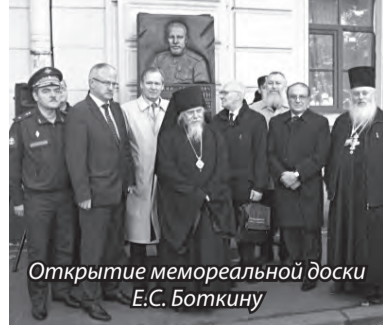
Открытие мемориальной доски Е.С. Боткину

Отношение к этой войне и свое предназначение в ней Евгений Сергеевич показал в изданной в 1908 г. книге «Свет и тени Русско-японской войны 1904–1905 гг.: Из писем к