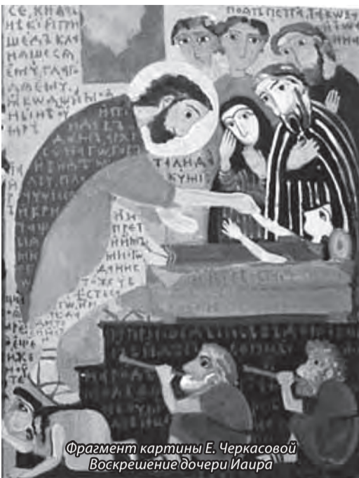
Фрагмент картины Е. Черкасовой Воскрешение дочери Иаира

Термин «эвтаназия» («хорошая смерть») – яркий пример того, как в одну и ту же словесную «оболочку» можно вкладывать совершенно разные, даже прямо противоположные смыслы.