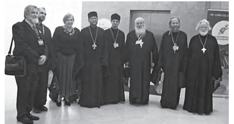
Организаторы и участники съездов ОПВР.

IV Всероссийский съезд православных врачей прошел в Самаре 3-4 октября 2013 г. под заголовком: «Духовные, социальные и медицинские основы сохранения здоровья населения». В рамках съезда состоялось пленарное заседание: «Современное здравоохранение и христианская мораль», прошли 2 круглых стола: «Врач и пациент: от рождения до смерти», «Медицинские новации и религиозные традиции: проблемы пасторского служения». В Самарском ГМУ была организована конференция: «Молодежное добровольчество и милосердие».