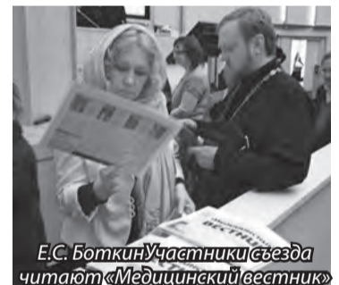
Е.С. Боткину Участники съезда читают «Медицинский вестник»