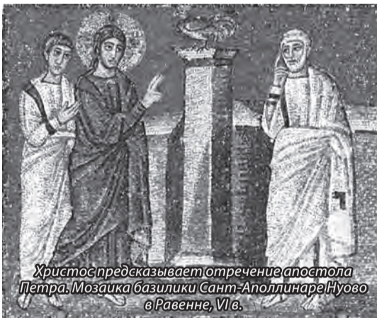
Христос предсказывает отречение апостола Петра. Мозаика базилики Сант-Аполлинаре Nuovo в Равенне, VI в.

речь идет о любви, потому что Господь видит глубины человека, а не поверхность, не только кажущееся, как видим мы. Когда человек совершит тот или другой поступок, скажет то или другое слово, мы понимаем поступок или слово по-своему. Христос смотрит вглубь и знает, какой человек стоит за поступком или за словом. Он не обманывается ни видимым, ни даже очевидным. И поэтому Он обращается к глубинам Петра, которые на какой-то момент заслонил страх, но которые открылись вновь, когда стыд его обжег и он вдруг оказался перед лицом и своей совести, и взора Спасителя. И Петр,