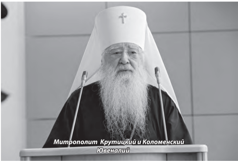
Митрополит Крутицкий и Коломенский Ювеналий

Издается по благословению Высокопреосвященнейшего Митрополита Крутицкого и Коломенского Ювеналия