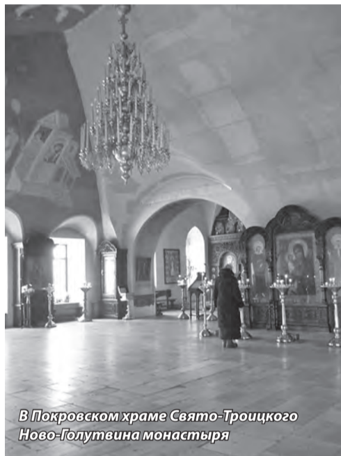
В Покровском храме Свято-Троицкого Ново-Голутвина монастыря

Господь от человека во время поста требует не голода, а подвига. У каждого своя мера этого подвижничества. Один во время