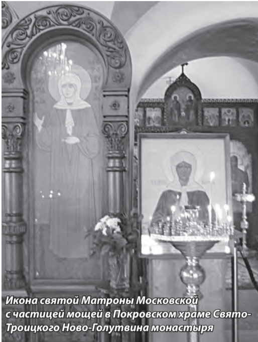
Икона святой Матроны Московской с частицей мощей в Покровском храме Свято-Троицкого Ново-Голутвина монастыря

Следует отметить, что слово «мощи» нужно понимать шире, чем просто тело усопшего праведника. В греческом и латинском языках оно связано с глаголом «оставляю».