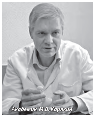
Академик М.В. Карякин

Дети, появившиеся на свет при помощи экстракорпорального оплодотворения (ЭКО), чаще обычных малышей страдают онкологическими заболеваниями, выяснили шведские учёные.