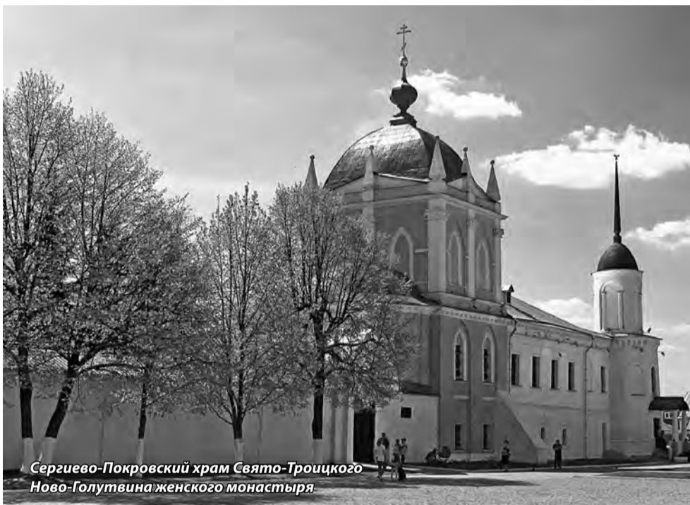
Сергиево-Покровский храм Свято-Троицкого Ново-Голутвина женского монастыря

«Человек – храм Божий» (Благолепие церковнославянского языка) М. 2014 г.