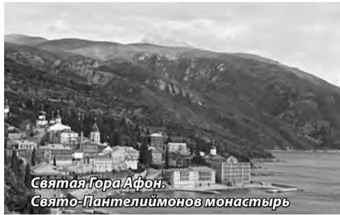
Святая Гора Афон. Свято-Пантелеимонов монастырь

В истории русского Афона Панагия особо значима как живая связь Афона и Иерусалима. Сюда пришёл старец из Русского Пантелеимонова мо-