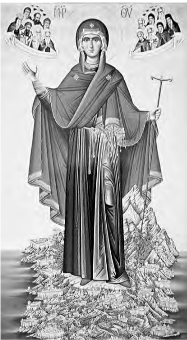
Когда душа в любви Божией, о, как тогда все хорошо, как все мило и

Воистину Она Заступница наша пред Богом, и одно имя Ее радует душу. Но и все небо и вся земля радуются о любви Ее.