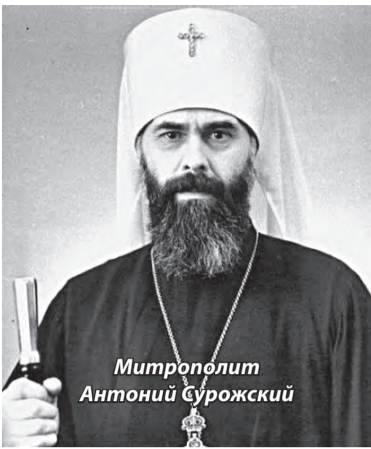
Митрополит Антоний Сурожский

Митрополит Сурожский Антоний (в миру Андрей Борисович Блум, Bloom) (1914–2004гг) родился в Лозанне (Швейцария) в семье сотрудника российской дипломатической службы. После революции 1917 года семья оказалась в эмиграции во Франции. Андрей Блум окончил биологический и медицинский факультеты университета Сорбонна в Париже.