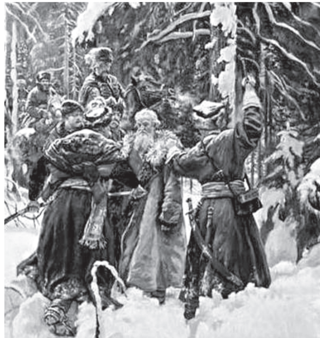
птора Н. А. Лавинского. На постаменте надпись: «Ивану Сусанину - патриоту земли русской».