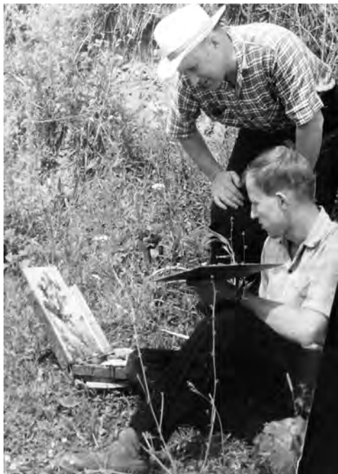
Плес, 1962 год