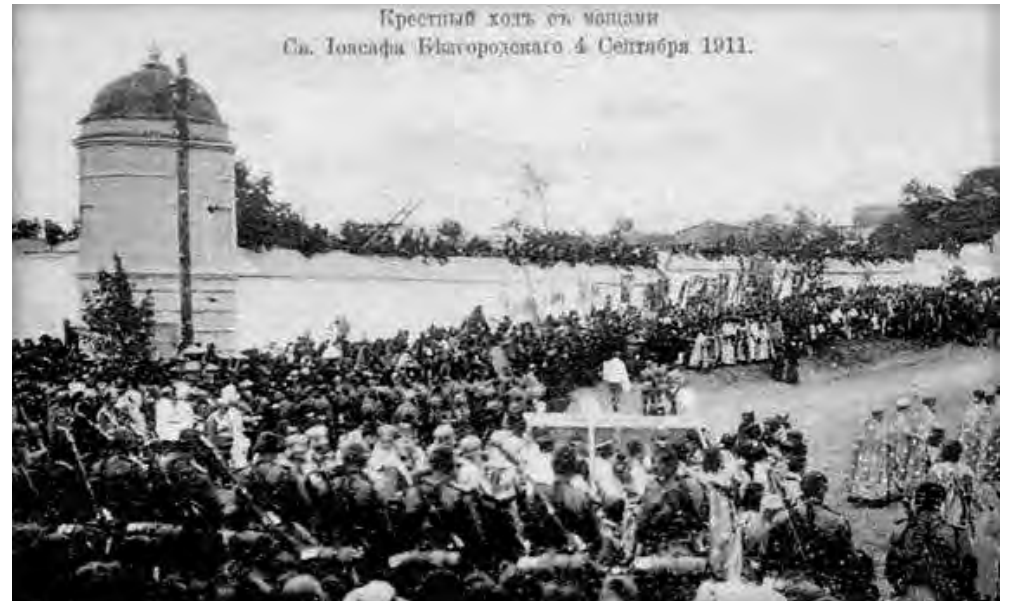
Крестный ход с мощами Св. Иоасафа Белгородского 4 сентября 1911.