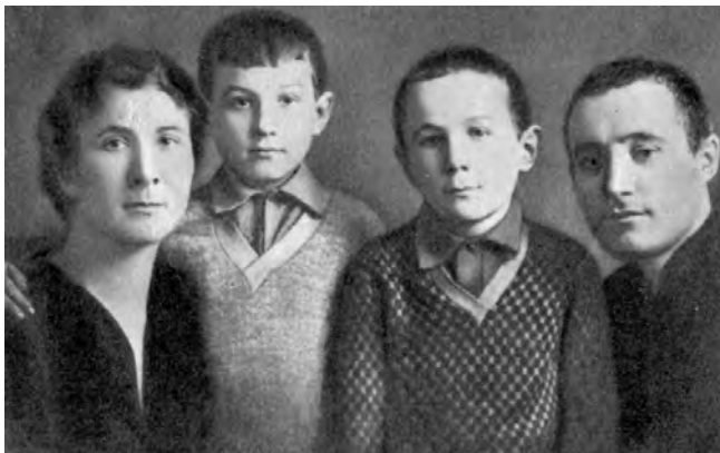
Семья Космодемьянских: мать, Шура, Зоя, отец

В 1929 году семья Космодемьянских уехала в Сибирь, спасаясь от доноса. Через год перебрались в Москву. В 1933 году умер отец.