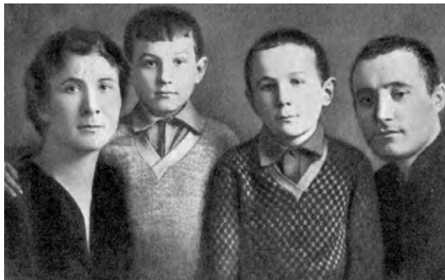
Семья Космодемьянских: мать, Шура, Зоя, отец

В 1929 году семья Космодемьянских уехала в Сибирь, спасаясь от доноса. Через год перебрались в Москву. В 1933 году умер отец.