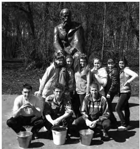
Студенты филфака в с. Даровое

В наш Киноклуб уже поступило множество предложений и пожеланий. Работа кипит и любители кино спешат поделиться своими наблюдениями. Может и у вас есть что-то, о чем вы хотите рассказать? Приходите и взгляните на мир через призму кинематографа!