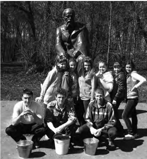
Студенты филфака в с. Даровое

В наш Киноклуб уже поступило множество предложений и пожеланий. Работа кипит и любители кино спешат поделиться своими наблюдениями. Может и у вас есть что-то, о чем вы хотите рассказать? Приходите и взгляните на мир через призму кинематографа!