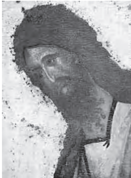
Св. Иоанн Креститель. Деисусный чин Благовещенского собора Московского Кремля. Феофан Грек.

Почему не пожалел своей жизни Иоанн? Да потому, что он — Глас Божий, Глас Истины. Потому, что он «правды соблюди еси, закон». Потому, что ему должно было пресечь соблазн, развращающий тех, ради кого на землю пришел Сын Божий. Ревность по Богу снесла его и не давала молчать. И Бог потерпел беззаконное