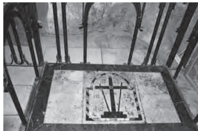
Место обретения Животворящего Креста Господня