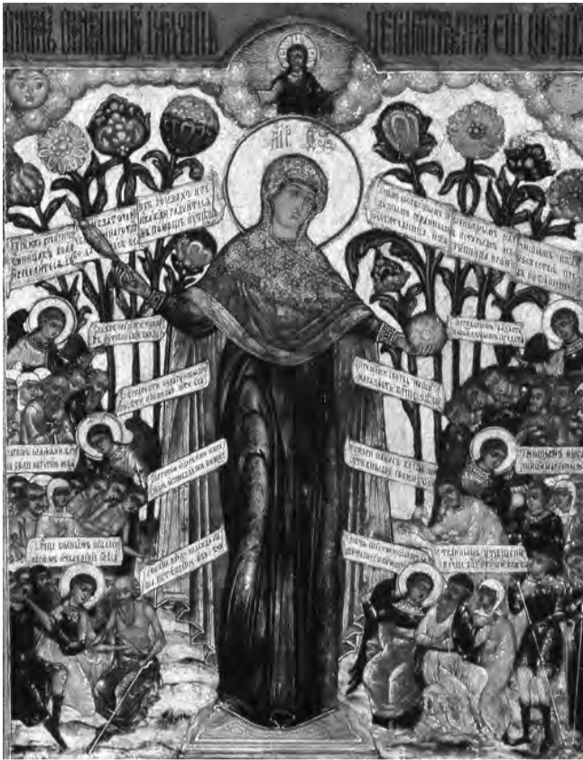
щих Радость», а самый храм получил и доселе сохраняет название Скорбященского.