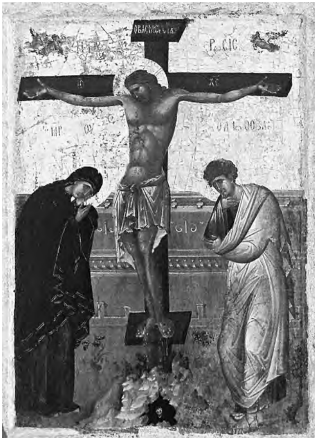
Распятие Христово. Византия, XIVв.

...Разве не могло быть, чтобы он, будучи на свободе, слышал проповедь Иисусову, был зрителем чудес Его и запомнил все это,