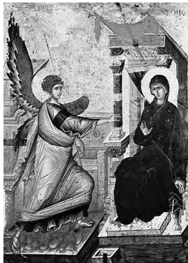
Благовещение. Византия, XIV в.

«Таинство, свершившееся в нынешний день, приводит в изумление не только человеческие, но и все ангельские, высокие умы. Недоумевают и они, как Бог безначальный, необъятный, неприступный, нисшел до образа раба и стал человеком, не перестав быть Богом и нимало не умалив славы Божественной? Как Дева могла вместить в пречистой утробе нестерпимый огонь Божества, и остаться неповрежденною, и пребыть на веки Матерью Бога воплощенного? Так велико, чудно, такой Божественной премудрости исполнено это таинство благовещения Архангелом Пресвятой Деве воплощения Сына Божия от Неё!».