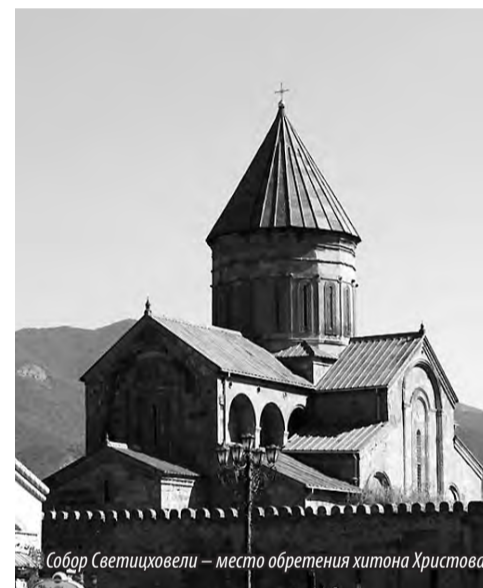
Собор Светицховели – место обретения хитона Христова

Источник: «Жития святых» свят. Димитрия Ростовского