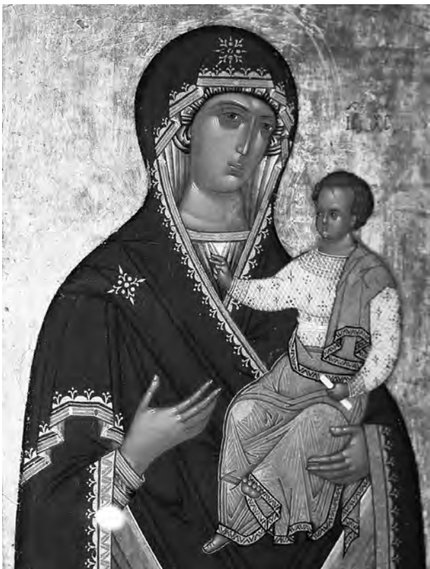
Смоленская икона Божией Матери, именуемая «Одигитрия», что значит «Путеводительница», по Церковному преданию, была написана святым евангелистом Лукой во время земной жизни Пресвятой Богородицы. Святитель Димитрий Ростовский предполагает, что этот образ был написан по просьбе антиохийского правителя Феофила. Из Антиохии святая была перенесена